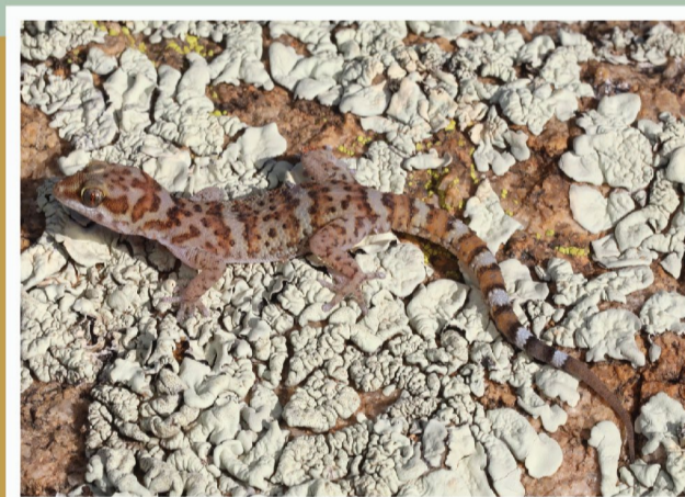
Weber se Geitjie ( Pachydactylus weberi )