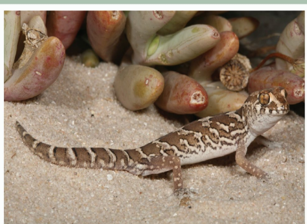
Grootskub Gebande Geitjie ( Pachydactylus macrolepis )