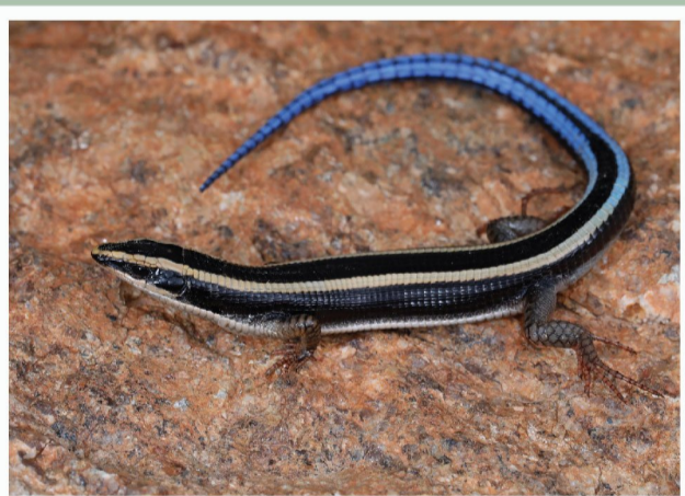
Dwerg Panserakkedis ( Cordylus subtaeniatus )