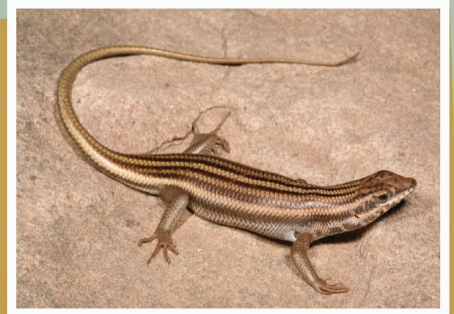
Westelike Rots Gladde Akkedis ( Trachylepis sulcata )