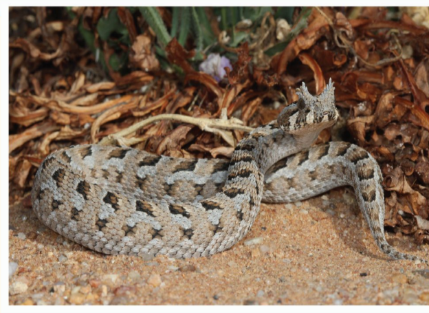
Veelhoringsgadder ( Bitis cornuta )