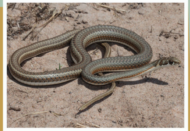
Karoo Sand slang ( Psammophis notostictus )