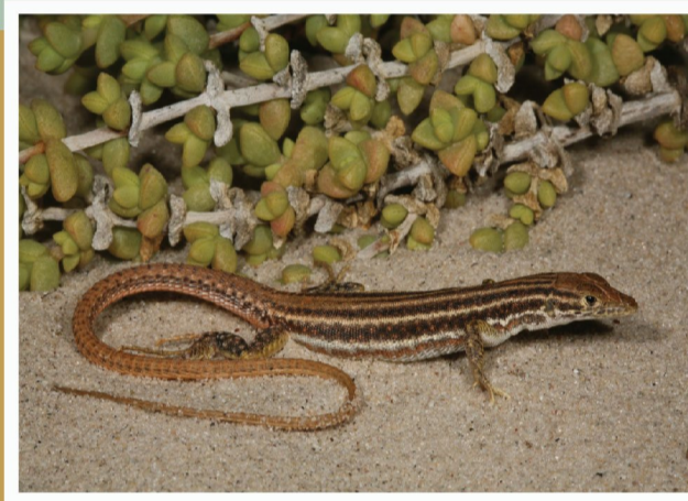
Namakwa Sandakkedis ( Pedioplanis namaquensis )