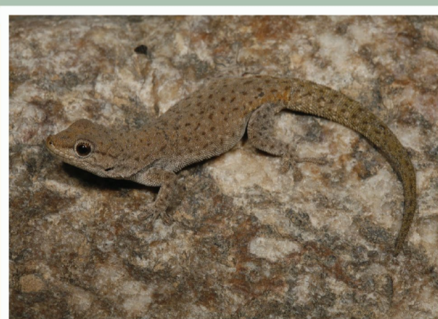
Namakwa Daggeitjie ( Rhoptropella ocellata )