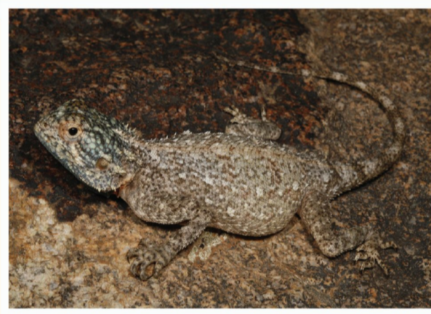
Suidelike Rotskoggelmander ( Agama atra )