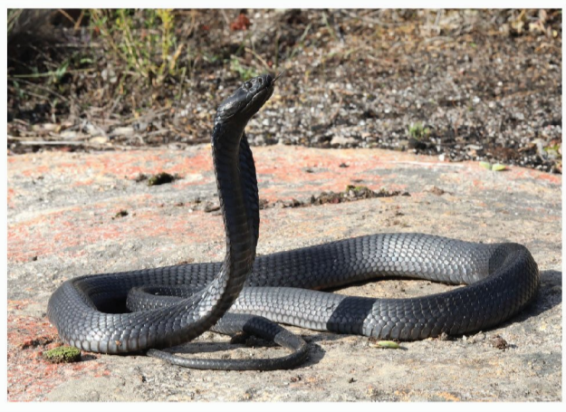
Swart Spoegkobra ( Naja nigricincta woodi )