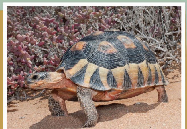
Ploegskaarskilpad ( Chersina angulata )

Die Kokerboom Biologiese Navorsingstasie is 'n fasiliteit van 850 hektaar, geleë tussen die ongerepte koppies van Namakwaland, net buite Springbok in die Noord-Kaap. Die gebied, bekend vir sy ryk biodiversiteit en unieke, endemiese flora, spog ook met diverse fauna en noemenswaardige geologie. Die stasie bied veilige, bekostigbare akkommodasie en veldwerkfasiliteite vir plaaslike en internasionale studente, wat samewerkende navorsing oor 'n wye reeks dissiplines ondersteun.