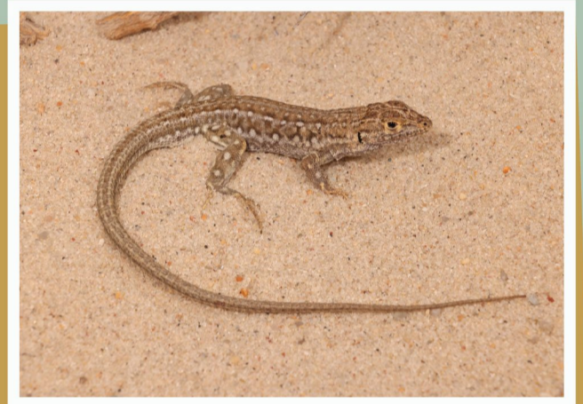
Knox se Woestynakkedis ( Meroles knoxii )