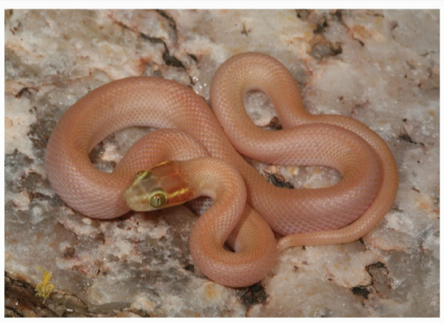
Groot-oog Huis slang ( Boaedon mentalis )