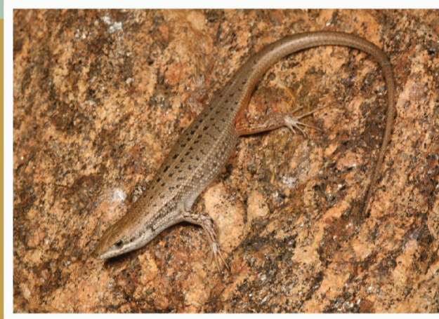
Bont Gladde Akkedis ( Trachylepis variegata )