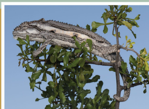
Westelike Dwergverkleurmantjie ( Bradypodion occidentale )