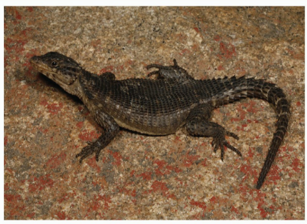
Karoo Gordelakkedis ( Karusasaurus polyzonus )