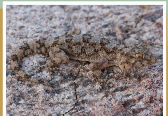
Namakwa Geitjie ( Pachydactylus namaquensis )