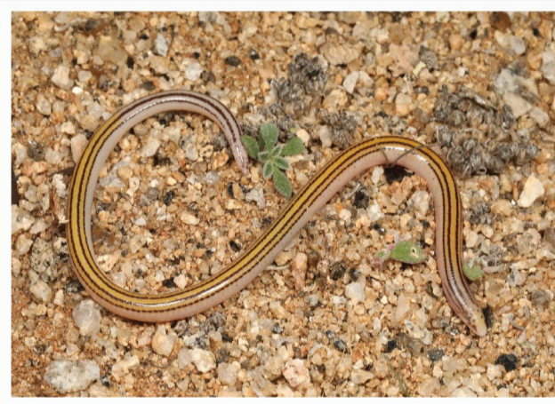
Namakwa Dwerg-pootlose Gladde Akkedis ( Acontias tristis/lineatus )